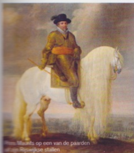
Prins Maurits op een van de paarden uit zijn Rijswijkse stallen