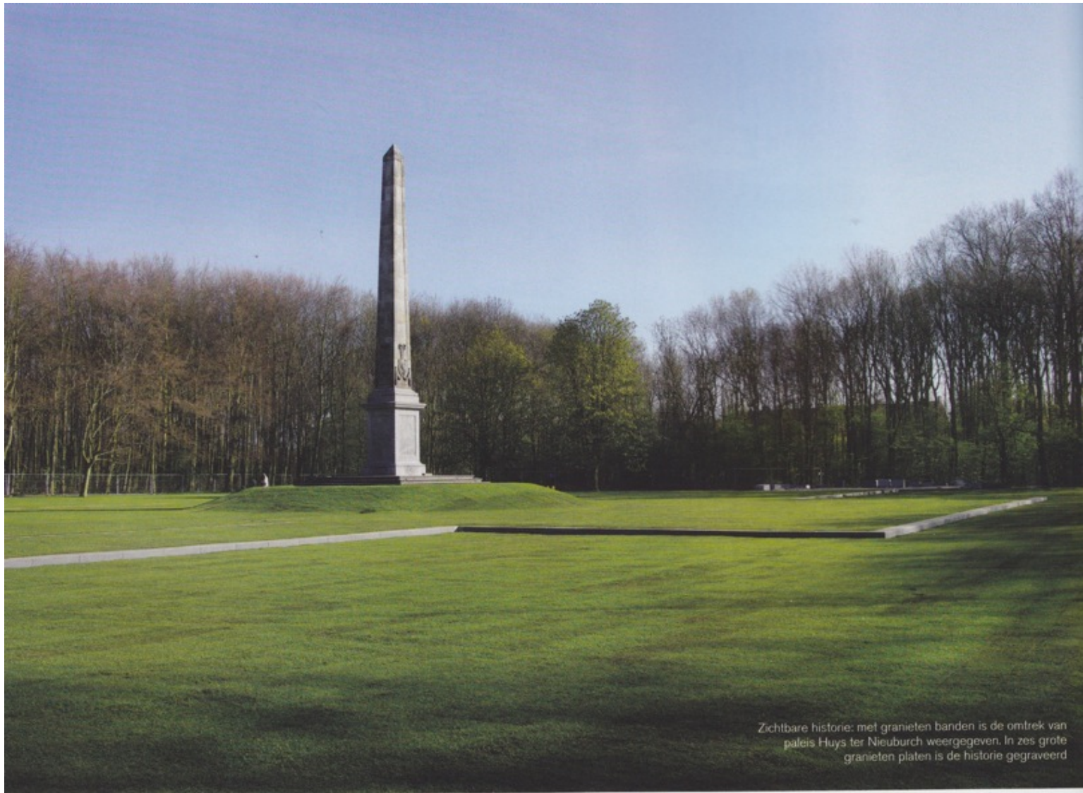
Zichtbare historie: met granieten banden is de omtrek van paleis Huys ter Nieuburch weergegeven. In zes grote granieten platen is de historie gegraveerd