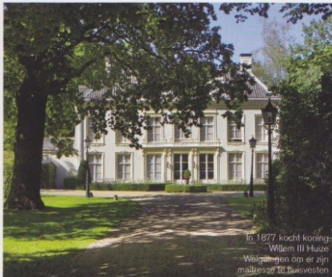
In 1877 kocht koning Willem III Huize Welgelegen om er zijn mistress te huisvesten